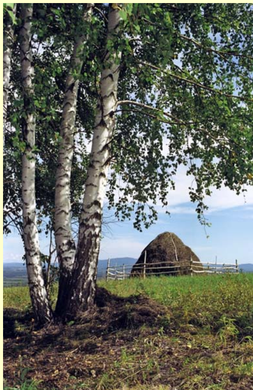
Imagen Licencia MSOffice

Hemos creado esta publicación gratuita titulada Webgrafías, disponible a través de Internet, con información acerca de diferentes temas de interés de nuestros clientes.