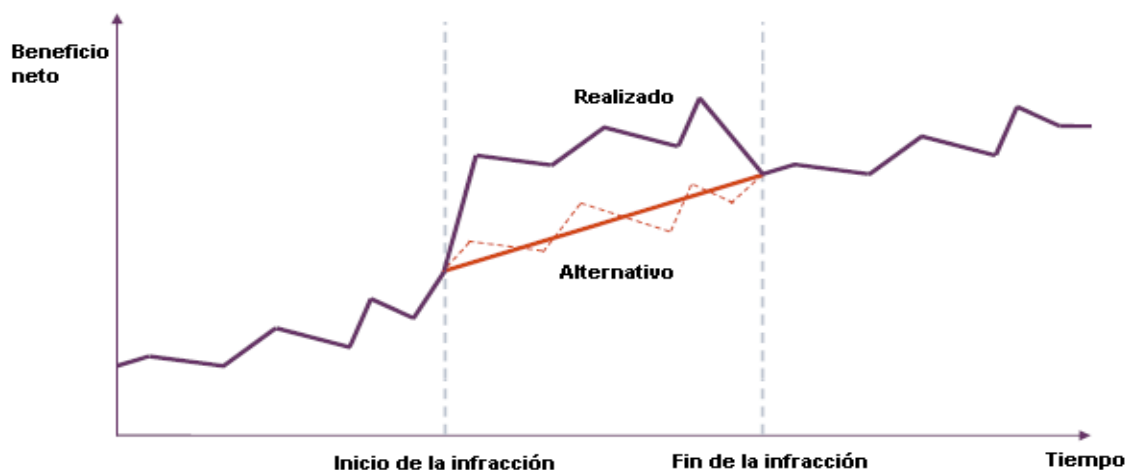
Gráfico 1 BENEFICIO ILÍCITO EN EL ESCENARIO ALTERNATIVO VS. ESCENARIO REALIZADO

A manera de ejemplo, el Gráfico 1 presenta el caso en el que el beneficio en el escenario alternativo es menor al realizado, durante el periodo en el que se llevó a cabo la conducta ilícita. Se observa que el beneficio durante la conducta ilícita es mayor a la tendencia que este estaba teniendo antes e, incluso, después de la conducta ilícita. Esto indicaría que, como resultado de la conducta ilícita, se obtuvo un beneficio que no se hubiera obtenido en ausencia de esta.