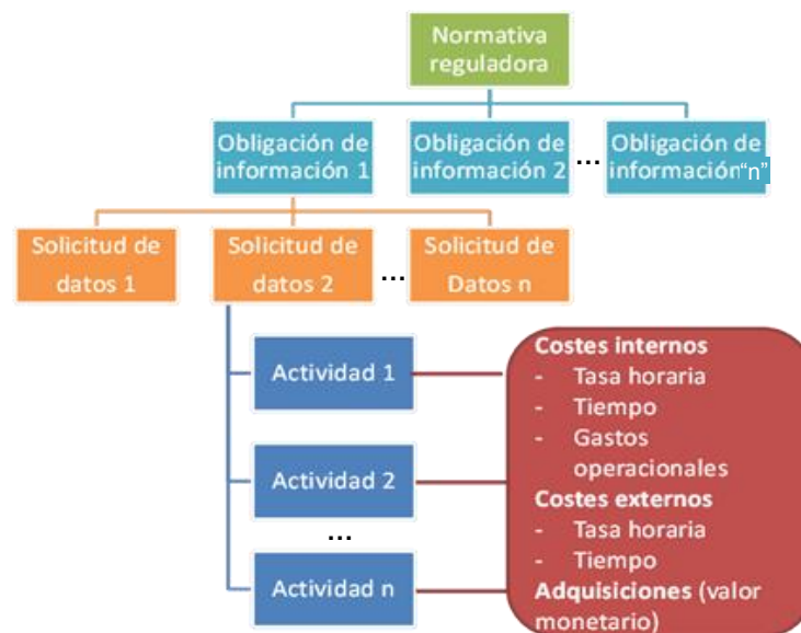
Diagrama 1 ESTRUCTURA METODOLÓGICA DEL MODELO DE COSTOS ESTÁNDAR