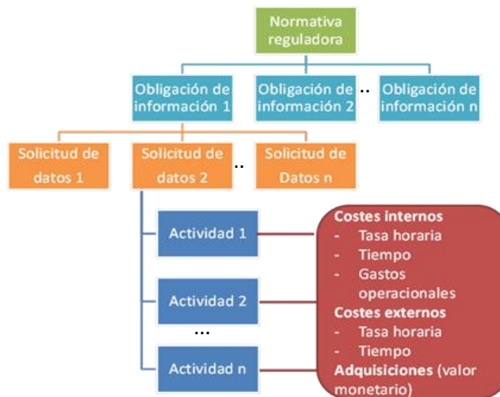
Diagrama 1 ESTRUCTURA METODOLÓGICA DEL MODELO DE COSTOS ESTÁNDAR