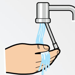
Grifo ahorrador de agua